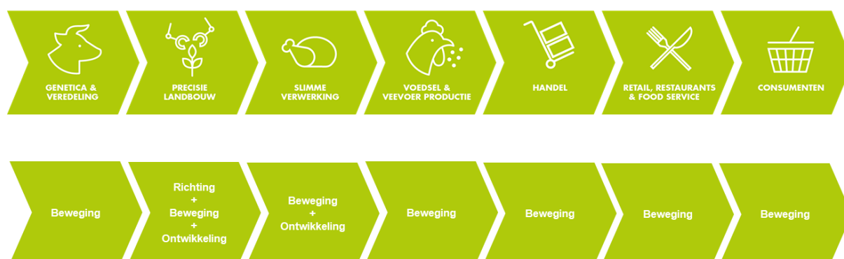
Figuur 2 – Rollen van de provincie