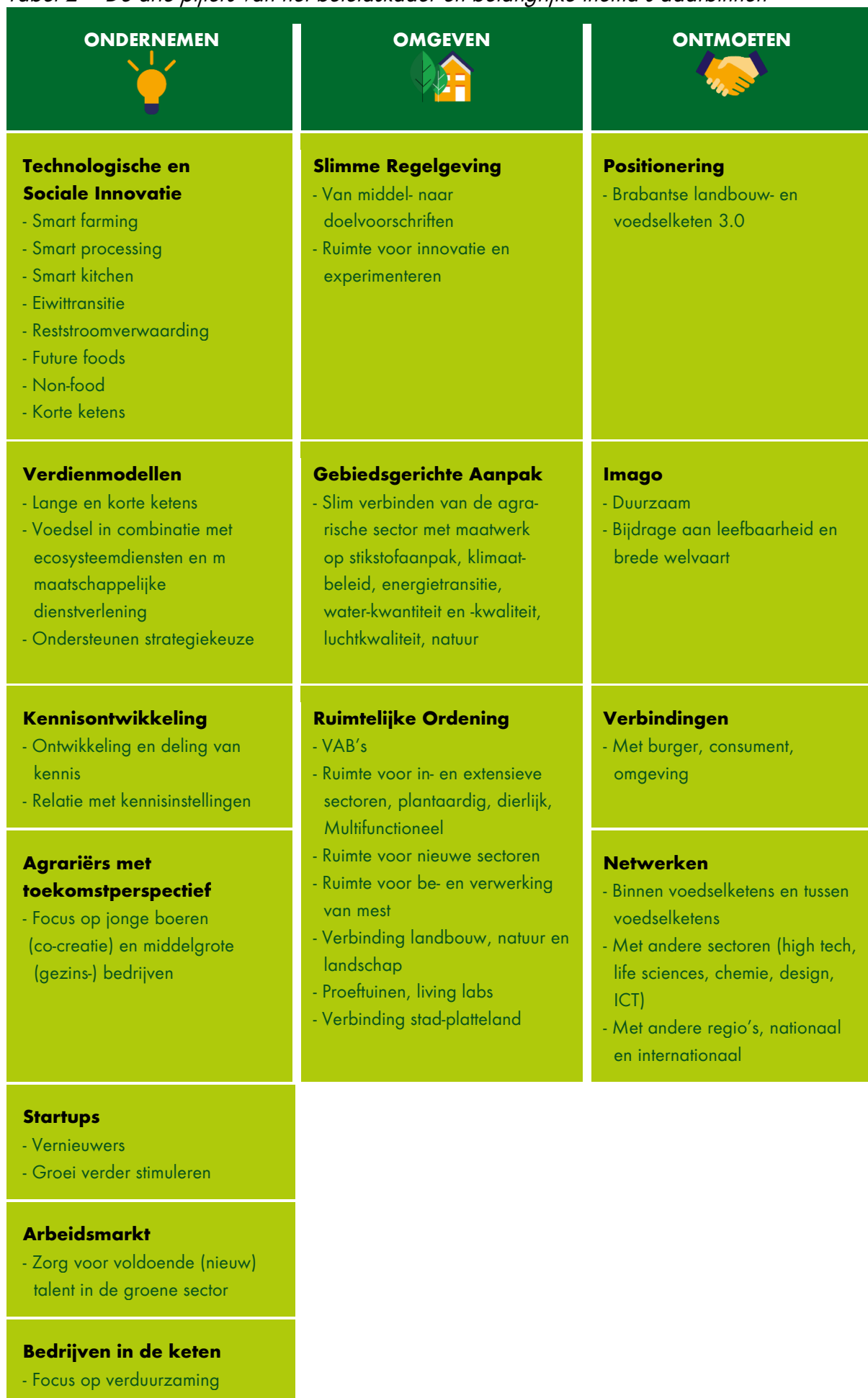
Tabel 2 – De drie pijlers van het beleidskader en belangrijke thema's daarbinnen