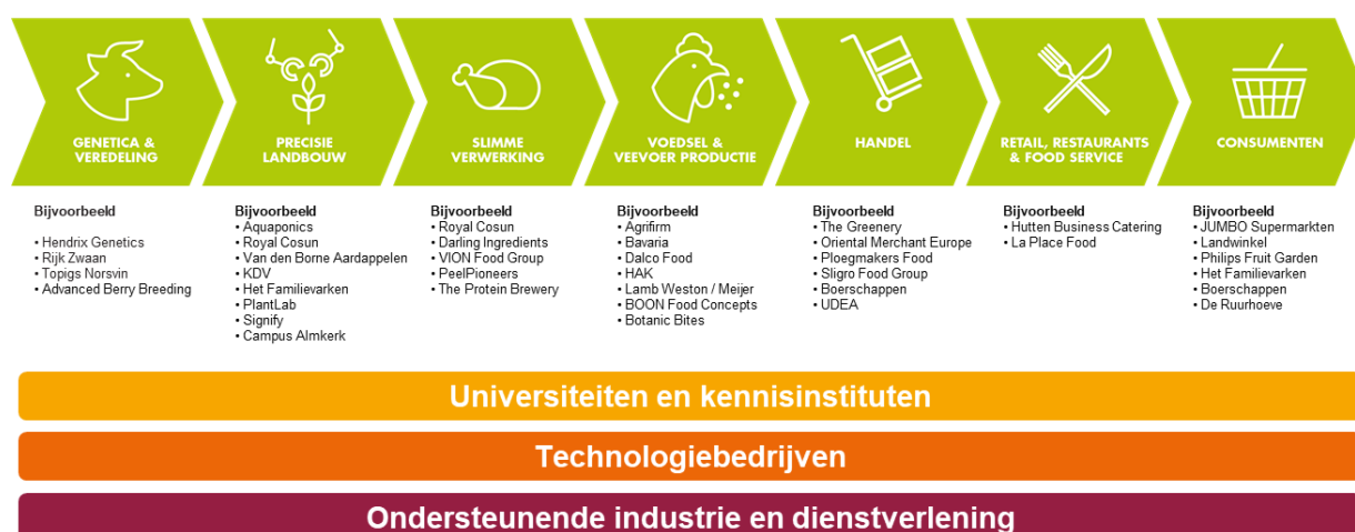
Figuur 1 - Het ondersteunende ecosysteem voor de Brabantse Landbouw en Voedselketen

Waar het totale landbouw- en voedselcomplex in Brabant economisch sterk en robuust is, wordt de primaire sector in rap tempo kleiner, zowel in aantallen bedrijven als in arbeidsplaatsen. De productiecapaciteit neemt echter niet af als gevolg van schaalvergroting. Deze strategie van schaalvergroting om bij krimpende marges het inkomen in stand te houden, stelt vooral de middelgrote (gezins-)bedrijven voor grote uitdagingen. Dit heeft geleid tot intensief gebruik van de grond en tot niet- grondgebonden productie met effecten voor de leefomgeving.