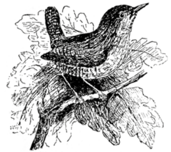
Het Winterkoninkje, onvermoed in het verdelgen van insecten.

Bij de combinatie van bospolitie en biodiversiteit denk je misschien wat heeft een BOA (buitengewoon opsporingsambtenaar), een boswachter met opsporingsbevoegdheid, te maken met biodiversiteit?