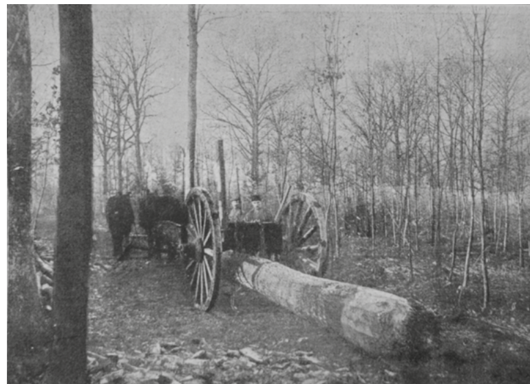
Vervoer van een zwaren eik met den „Mallejan“. Rechts een jonge eikenbeplanting.

Wil je meer weten over biodiversiteit in het bos en over het belang van staand en liggend dood hout in het bos? Kijk dan eens op https://boslessen.nl/ en ga naar les 8 over biodiversiteit. ■